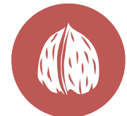
Frutos de cáscara Nuts