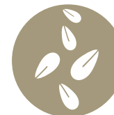
Granos de sésamo Sesame seed