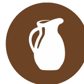
Lácteos Dairy products