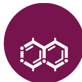
Dióxido de azufre y sulfitos Sulphites