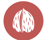
Frutos de cáscara Nuts