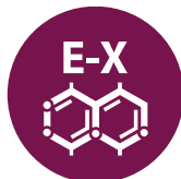
Dióxido de azufre y sulfitos Sulphites